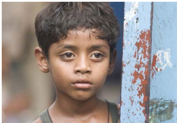
Кадр из фильма «Миллионер из трущоб»

Во-вторых, повествование о детстве паренька Джамала начинается с индуистского погрома в мусульманском квартале. Этой темы в индийском кинематографе и индийских