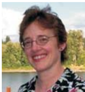
ЛЕСЛИ ЭЛЛИОТТ АРМИЖУ приглашенный профессор Университета штата Орегон Специально для РЖ

Какой тип лидера больше подходит для того, чтобы удержать страну от краха? Иногда утверждают, что с этим лучше справляются авторитарные лидеры. Сторонники этого взгляда ссылаются на пример Ли Куан Ю в Сингапуре. Но есть и противоположные примеры: Роберт Мугабе поставил Зимбабве на грань национальной катастрофы.